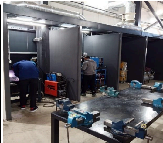
Şekil 3. Derslik ve laboratuvarlarımız