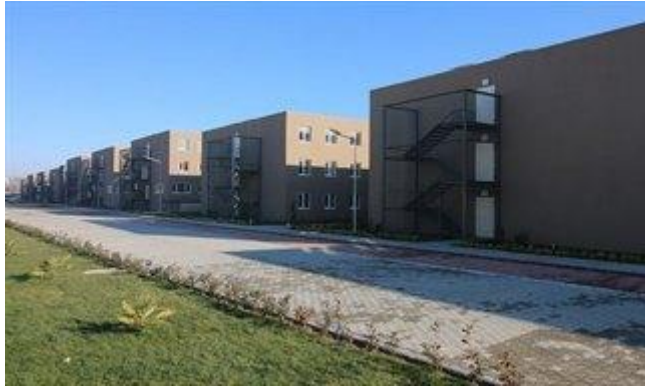
Şekil 2. Muhammet Fatih Safitürk KYK Erkek Öğrenci Yurdu

Arifiye Meslek Yüksekokulu yerleşkesine beş yüz metre mesafede 2000 kişilik Muhammet Fatih Safitürk KYK Erkek Öğrenci yurdu bulunmaktadır.