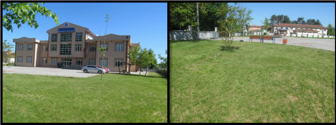
Şekil 1. MYO Yerleşkemiz

Okulumuzda uygulanan 3+1 eğitim modeli ile her öğrencimiz 16 hafta tam zamanlı olarak ülkemizin önde gelen sanayi kuruluşlarında Mesleki Uygulama yapmaktadır. Bu sayede öğrencilerimiz sanayi tecrübesi kazanarak mezun olmanın avantajlarını yaşamaktadır. Öğrencilerimizin birçoğu uzun dönem staj yaptığı işletmelerde istihdam edilmekte ve işe girme sorunu yaşamamaktadır.