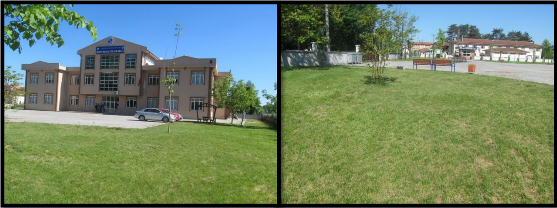
Şekil 1. MYO Yerleşkemiz

Mesleki eğitim-öğretimde hedeflediği yüksek kalite standartlarıyla mezunlarına uygulama becerisi kazandırma yetkinliği ile ulusal ve uluslararası düzeyde adından söz ettiren; iş dünyası ile iş birliği içinde geleceğin nitelikli işgücü ihtiyacını karşılamaya yönelik etkili çözümler üreten, takım çalışmasını teşvik eden, demokratik, şeffaf, iletişime ve değişime açık bireyler yetiştirmek amacımızdır.