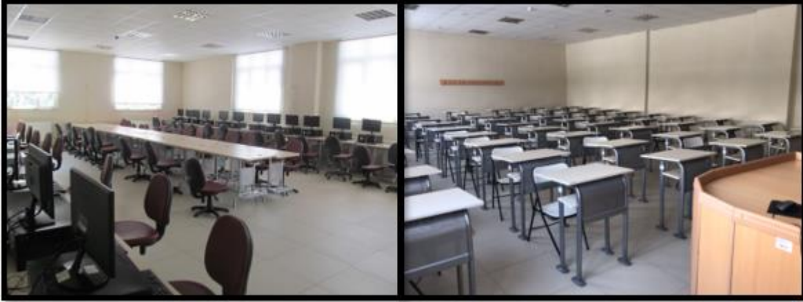
Şekil 3. Derslik ve laboratuvarlarımız

Okulumuzda 12 tane derslik, 2 tane Bilgisayar, 1 tane Mekatronik laboratuvarı, 1 tane Motor Simülasyon atölyesi ve 1 tane Kaynak Laboratuvarımız vardır.