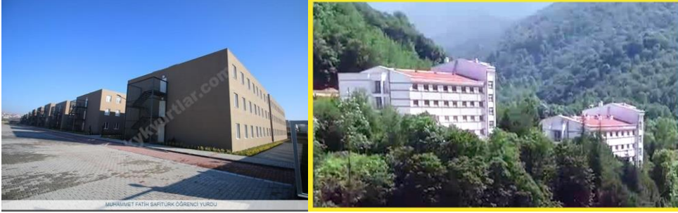
Şekil 2. Okulumuza yakın KYK Yurtları

Arifiye Meslek Yüksekokulu Yerleşkesine beş yüz metre mesafede Kredi Yurtlar Kurumu'nun (KYK) 2000 kişilik erkek öğrenci yurdu bulunmaktadır ve ayrıca 500 kişilik KYK kız öğrenci yurdu Meslek Yüksekokulumuza yakın bir konumdadır.