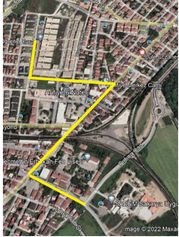
Şekil 2. Okulumuz ve KYK Yurtları