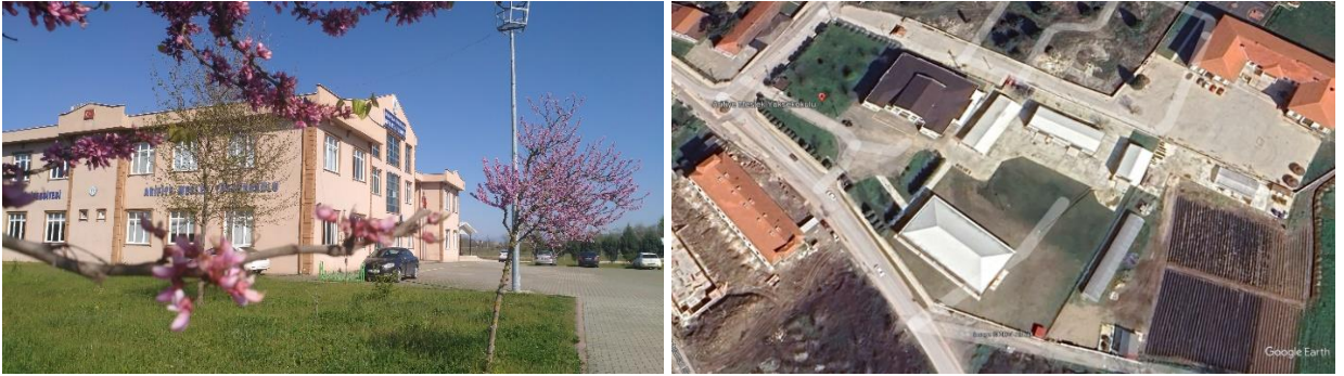
Şekil 1. MYO Yerleşkemiz

Mesleki eğitim-öğretimde hedeflediği yüksek kalite standartlarıyla mezunlarına uygulama becerisi kazandırma yetkinliği ile ulusal ve uluslararası düzeyde adından söz ettiren; iş dünyası ile iş birliği içinde geleceğin nitelikli işgücü ihtiyacını karşılamaya yönelik etkili çözümler üreten, takım çalışmasını teşvik eden, demokratik, şeffaf, iletişime ve değişime açık bireyler yetiştirmek amacımızdır.