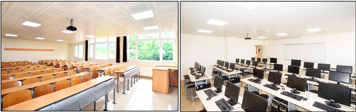
Şekil 3. Derslik ve laboratuvarlarımız

Okulumuzda 11 derslik 1 Bilgisayar Laboratuvarı 1 Teknik Resim Sınıfı 1 Otomotiv Laboratuvarı ve yapımı devam eden Kaynak Laboratuvarı vardır.