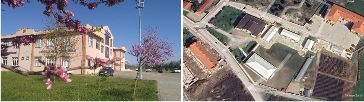
Şekil 1. MYO Yerleşkemiz

Mesleki eğitim-öğretimde hedeflediği yüksek kalite standartlarıyla mezunlarına uygulama becerisi kazandırma yetkinliği ile ulusal ve uluslararası düzeyde adından söz ettiren; iş dünyası ile iş birliği içinde geleceğin nitelikli işgücü ihtiyacını karşılamaya yönelik etkili çözümler üreten, takım çalışmasını teşvik eden, demokratik, şeffaf, iletişime ve değişime açık bireyler yetiştirmek amacımızdır.